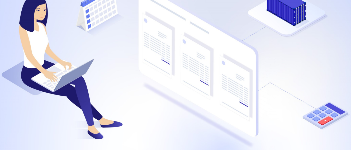
TABLEAU DE BORD FACTURES